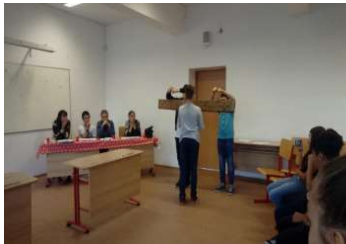
Concursul „Toacă în Cer și pe Pământ”