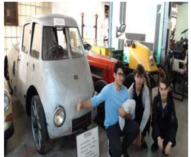
În vizită la Muzeul Tehnic