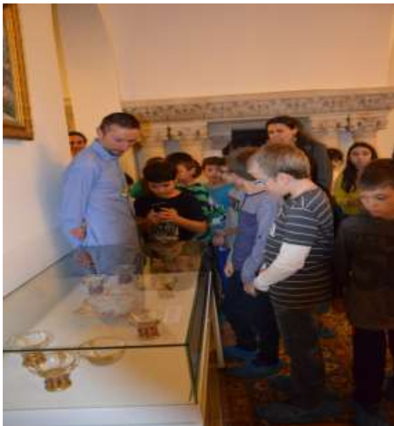
În vizită la Muzeul Cotroceni