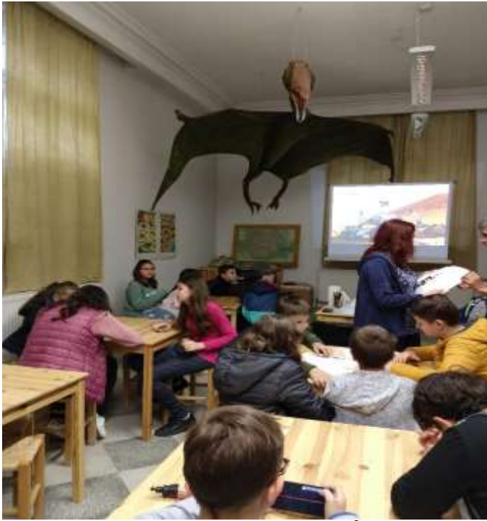
În vizită la Muzeul de Geologie