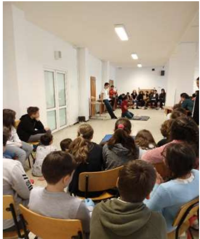
Cum acordăm primul ajutor