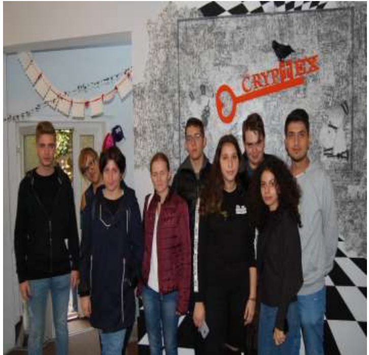
Clasa a XII-a C – Cryptex Escape Room