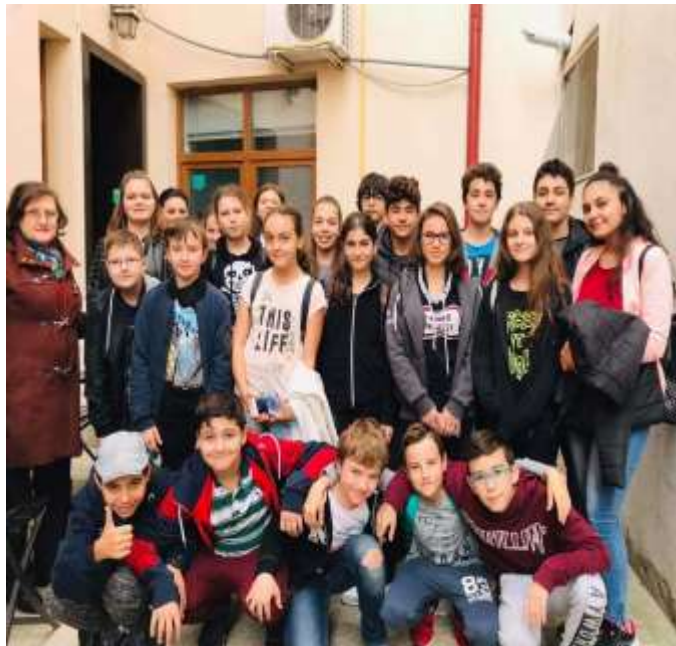
În vizită la Escape Room