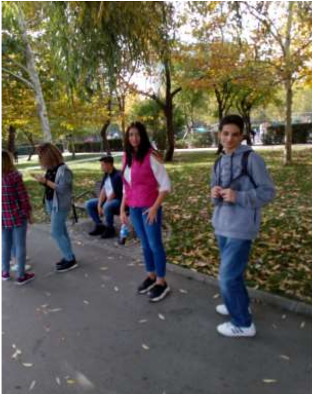
Clasa a XI-a C – plimbare în Parcul IOR