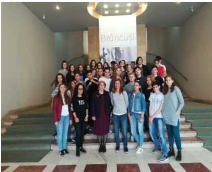
Clasele a IX-a D și a X-a E – Vizită la Muzeul de Artă