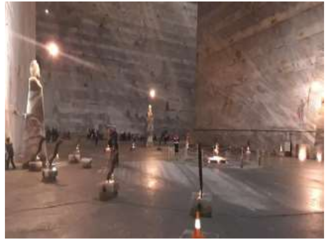
În vizită la salina din Slănic Prahova