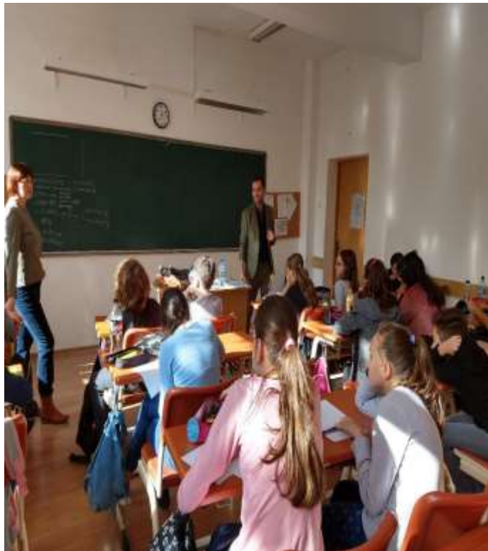
Prezentare pe tema Nutriției sănătoase