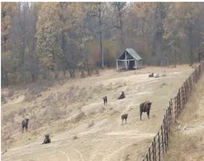
La rezervația de zimbrii de la Bușani