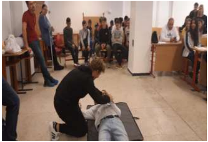
Să acordăm primul ajutor