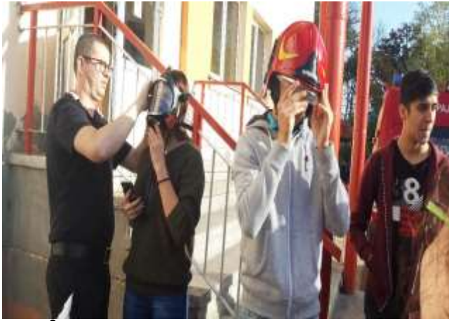
În luptă cu focul! – la ISU Morarilor