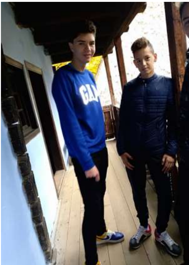
Clasa a IX-a E - În vizită la Muzeul Satului și la Muzeul Tehnic