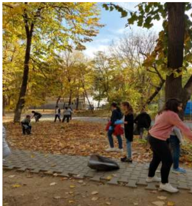
Acțiune de ecologizare în curtea liceului