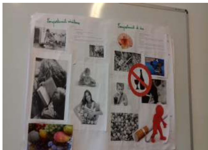
Clasa a VII-a A – Comportamente sănătoase/comportamente de risc