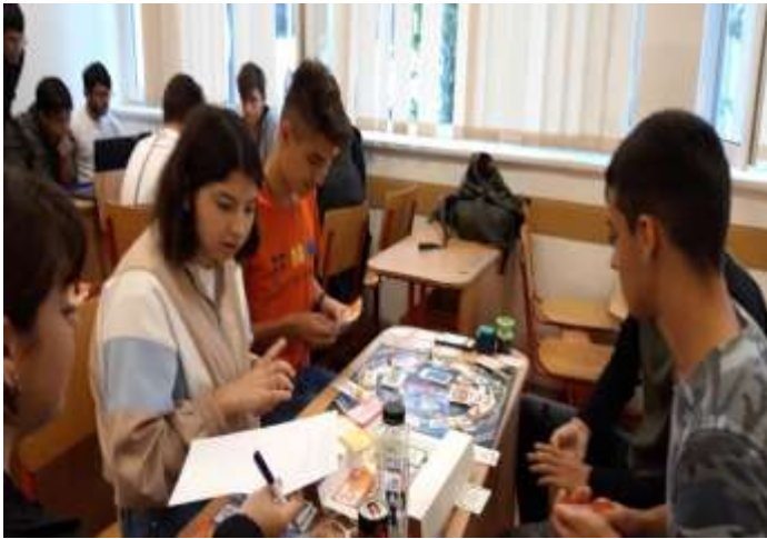
Să ne antrenăm mintea – joc distractiv