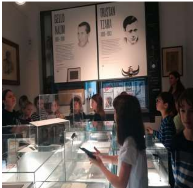
Și la Muzeul Literaturii Române