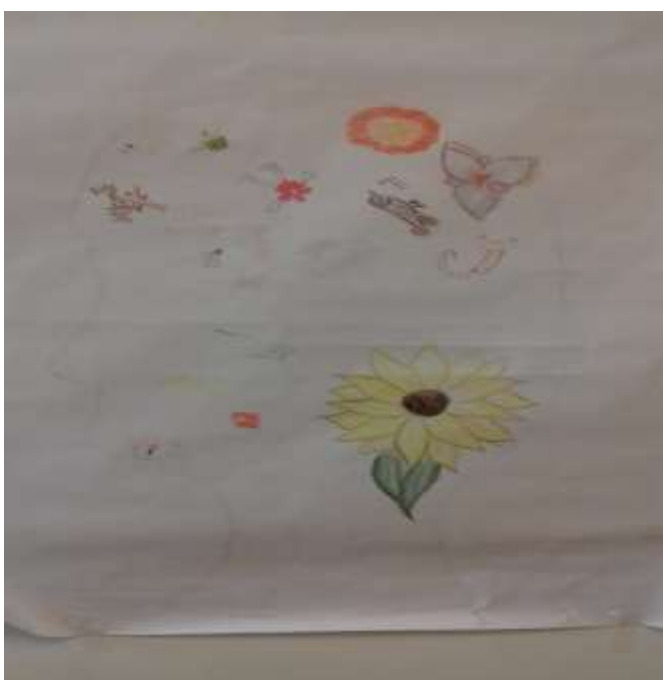
Clasa a IX-a C – Coeziunea grupului