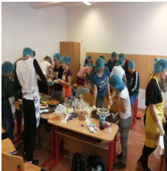
Preparăm tortul „Școala Altfel”