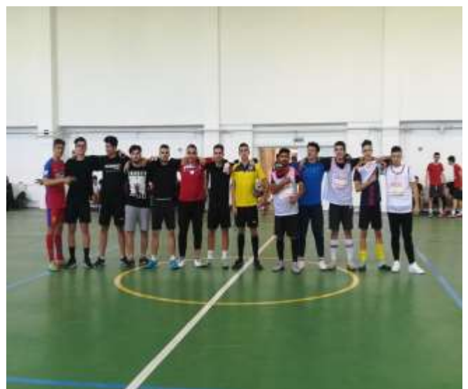
Campionatul de fotbal al liceului