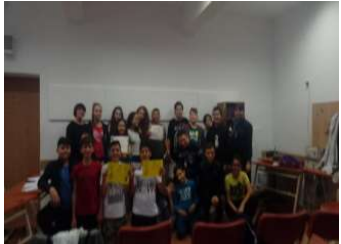
„Elevii au talent” – rezultatele concursului