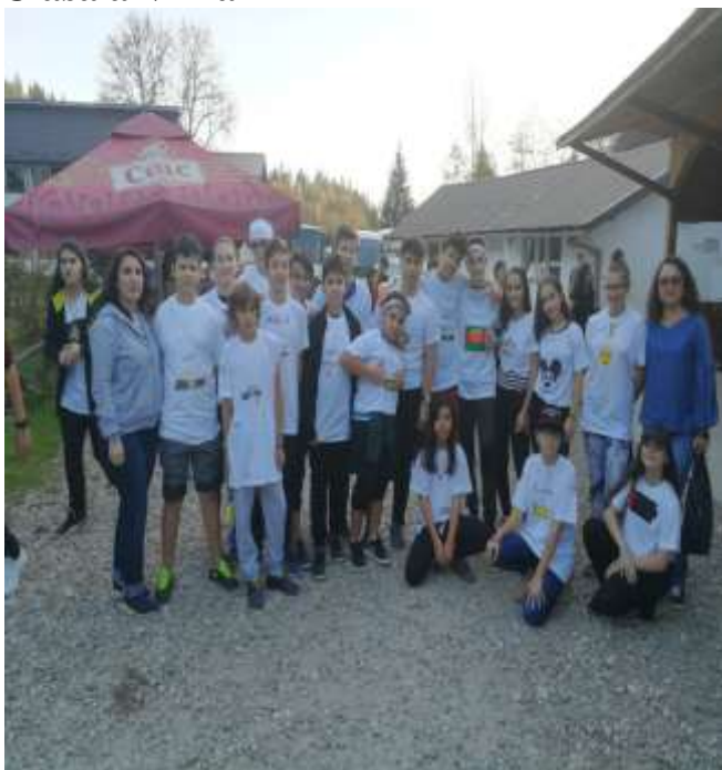
În excursie la Bughea