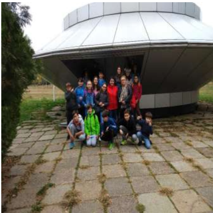
Vizită naveta spațială Green Bee