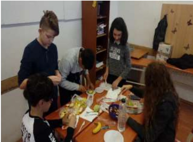
Să preparăm o salată de fructe